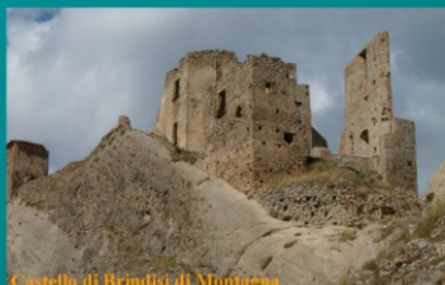
Castello di Brindisi di Montagna