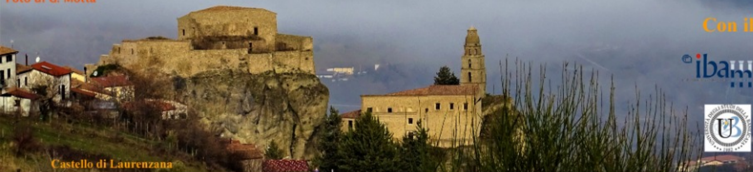
Castello di Laurenzana